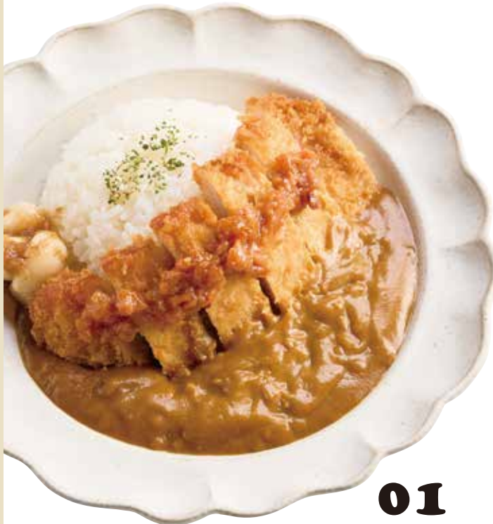
01 梅肉にんにく太郎 やみつきカレーに!

01 梅肉 にんにく太郎 賞味期限 製造日より4ヶ月 にんにく梅肉とおかが風味が豊かに合わさって、 つついあんとをひく美味しさ! 品番1164 280g入 1,296円(税込) 品番1246 280g入×3個 3,564円(税込) お得!