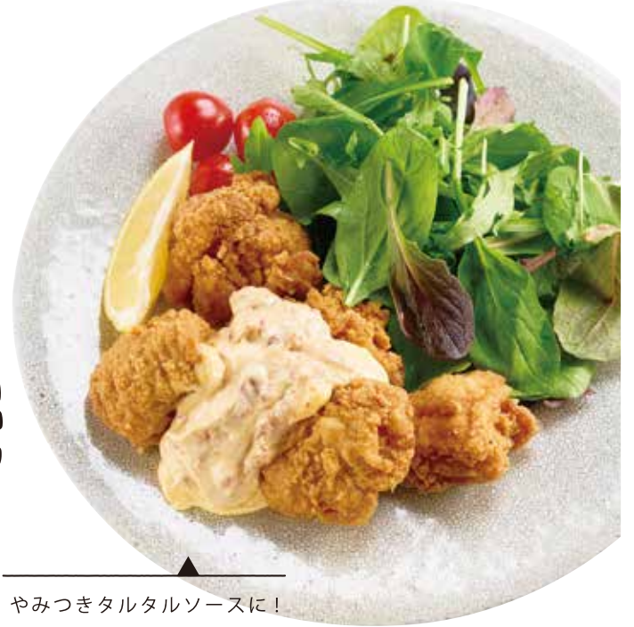
02 からあげの素 やみつきタルタルソースに!

02 梅干屋が作った からあげの素 賞味期限 製造日より6ヶ月 梅酢にんにく風味 鶏肉にからあげの素をほろほろ3分お いてから小麦粉や片栗粉をまぶして揚 げてください。 品番7045 300ml入 540円(税込) 品番7045s 300ml入×3本 1,500円(税込) お得!