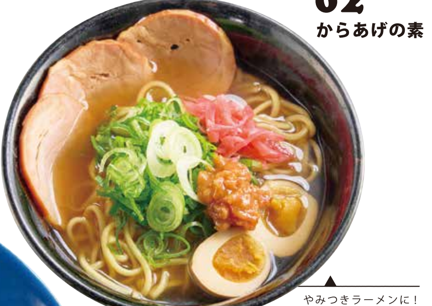
やみつきラーメンに!